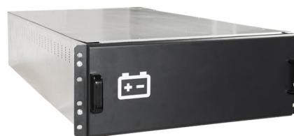
Beispiel: 19"-Schrank mit Standard-Batteriemodul